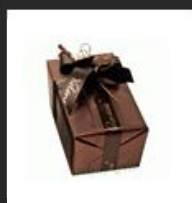
Bombones Belgas Valentino